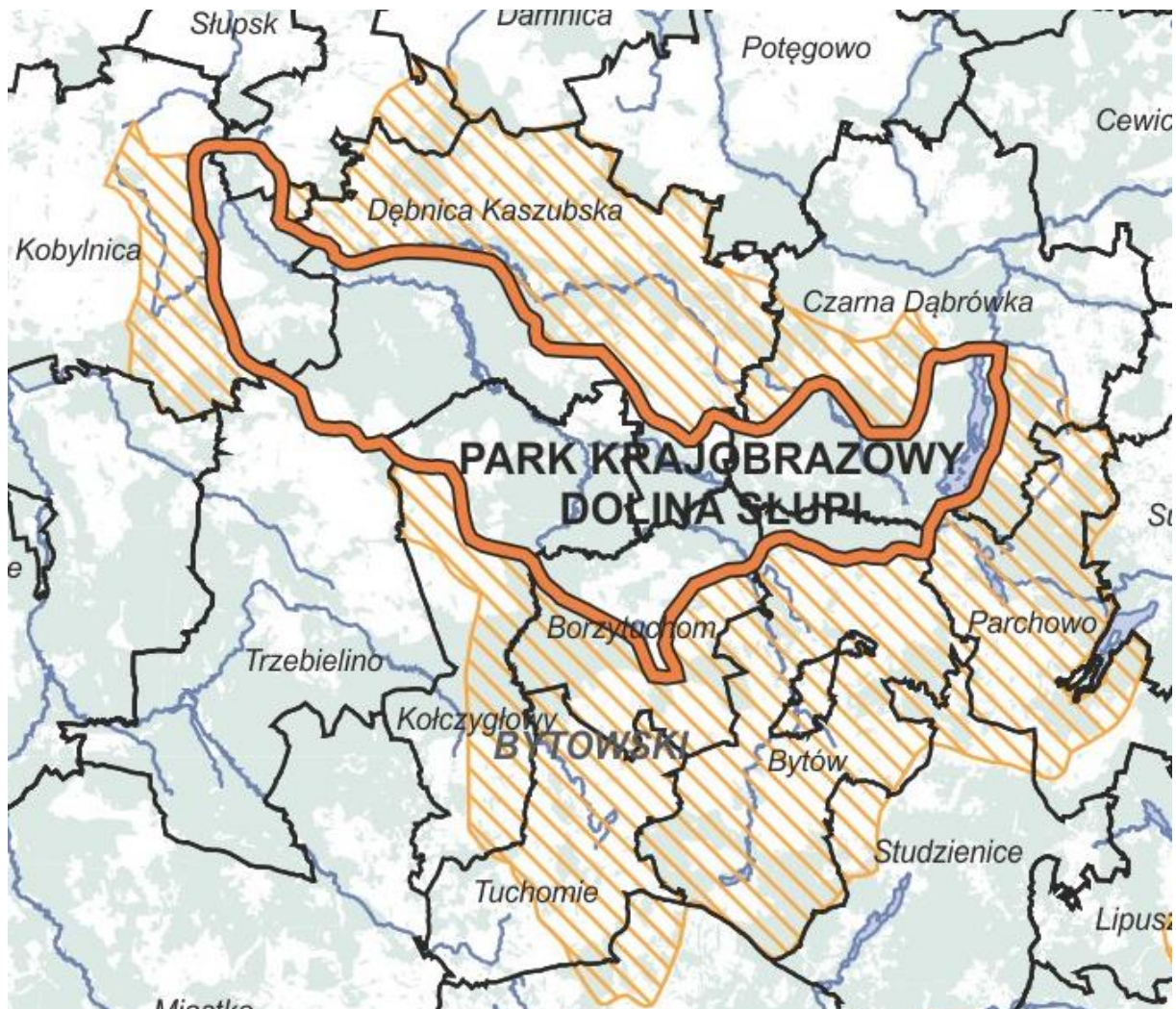
Rysunek 3. Lokalizacja Parku Krajobrazowego „Dolina Słupi”

narodowego lub krajobrazowego odpowiada dyrektor parku. Na pozostałym obszarze gminy – właściwy miejscowo wójt. W związku z tym niniejsza analiza zagrożeń dotyczy obszaru Gminy Dębica Kaszubska zlokalizowanego poza terenem Parku Krajobrazowego „Dolina Słupi”. Analiza zagrożeń dla obszaru Gminy Dębica Kaszubska, na której znajduje się Park Krajobrazowy „Dolina Słupi” została sporządzona w 2019 roku i można ją odnaleźć w dokumencie pod nazwą „Analiza zagrożeń, w tym identyfikacja miejsc, w których występuje zagrożenie dla bezpieczeństwa osób wykorzystujących obszar wodny do pływania, kąpania się, uprawiania sportu lub rekreacji na terenie Parku Krajobrazowego „Dolina Słupi”, znajdującym się na stronie internetowej Pomorskiego Zespołu Parków Krajobrazowych Park Krajobrazowy „Dolina Słupi” www.dolinaslupi.pl