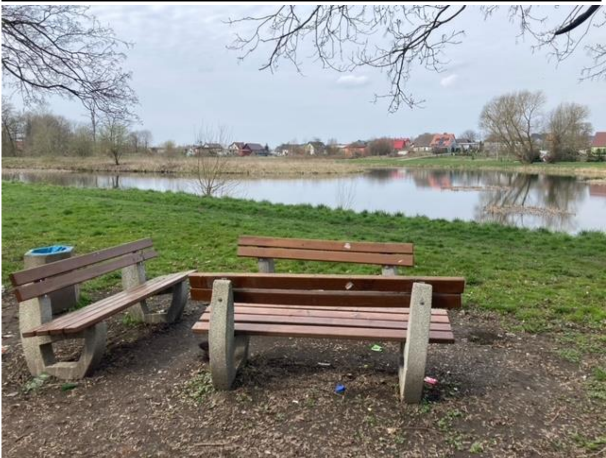
Zdjęcie 3. Zbiornik w Motarzynie – zagospodarowanie terenu