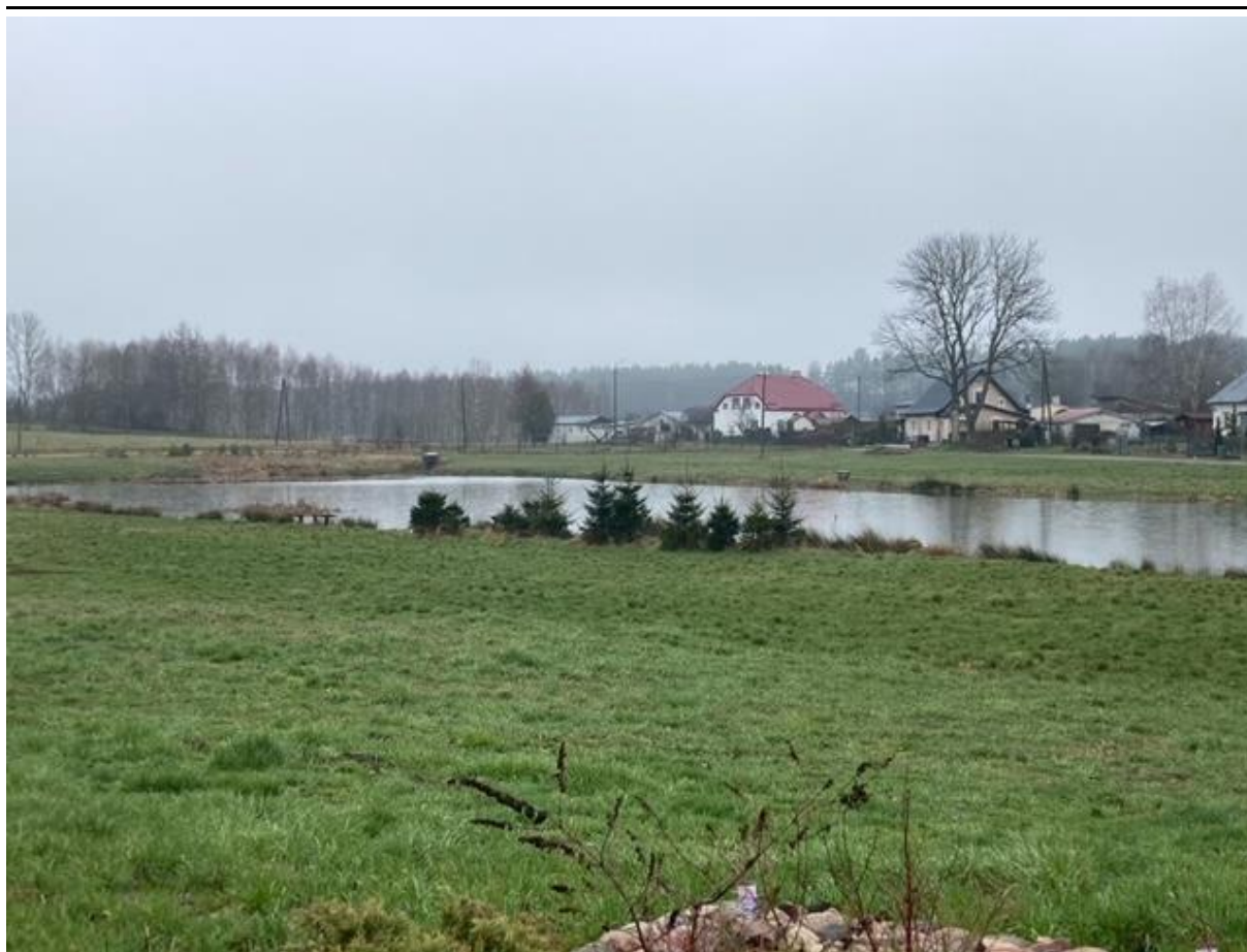
Zdjęcie 2. Staw w Gogolewie – widok na zbiornik od strony drogi powiatowej