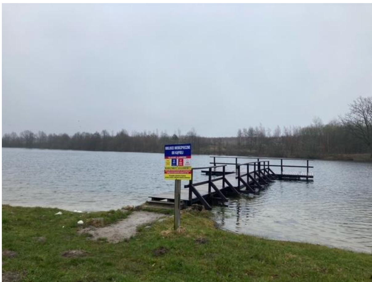
Zdjęcie 1. Jezioro Dobrskie – widok na pomost z oznakowaniem miejsca niebezpiecznego do kąpieli

Jezioro rynnowe znajdujące się w okolicy wsi Dobra. Właścicielem jest Skarb Państwa. Jego powierzchnia to 28,5 ha, a maksymalna głębokość to 12 m. Nad jeziorem nie wyznaczono kąpieliska lub miejsca okazjonalnie wykorzystywanego do kąpieli. Mimo to jezioro chętnie jest wykorzystywane do tzw. „dzikich kąpieli” oraz rekreacji wodnej. Na terenie „dzikiego kąpieliska” została zamontowana tablica wskazująca na miejsce niebezpieczne do kąpieli, informująca o telefonach alarmowych. Z uwagi na to, że osoby kąpiące się w zbiorniku nie stosują się do zakazu stanowi to podstawę do uznania tego miejsca za niebezpieczne, a zachowania tych osób mogą skutkować utratą zdrowia lub życia.