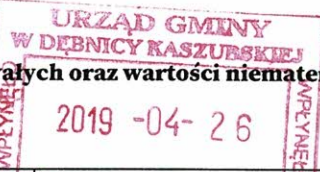
TABELA NR 2

Zmiana stanu umorzenia/amortyzacji środków trwałych oraz wartości niematerialnych i prawnych - stan na dzień 31 grudnia 2018 roku.