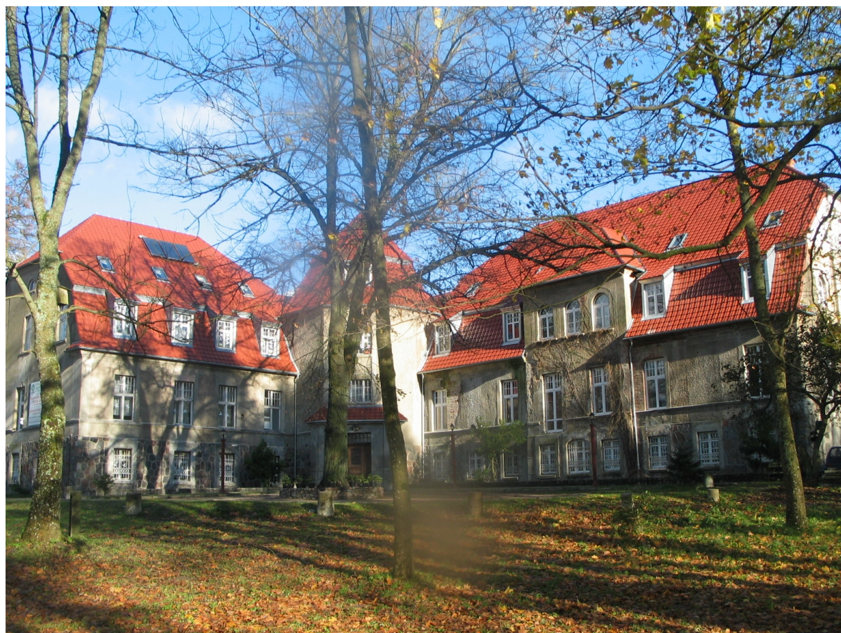
Niepogłędzie wrzesień 2014 r.